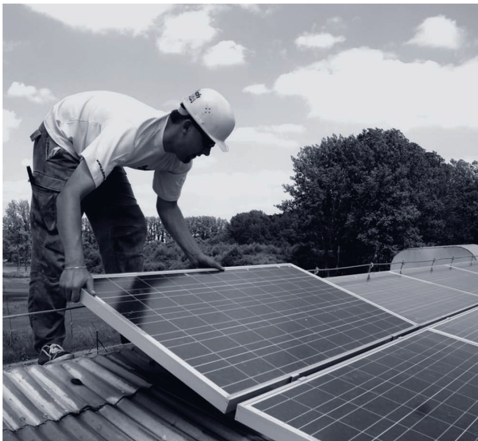
montáž solárních panelů fotovoltaické elektrárny

Základy investičních a developerských společností pod obchodním názvem SUNINVEST byly položeny v roce 2007, založením mateřské společnosti nesoucí název Suninvest Moravia, s.r.o. a posléze také Suninvest Slovácko, s.r.o. Záměrem managementu obou firem byla od prvopočátku výstavba a provoz fotovoltaických elektráren opírající se o zákon 180/2005 Sb., který vstoupil v platnost od 1. srpna 2005 v rámci podpory energií z obnovitelných zdrojů a který vychází ze směrnice Evropského parlamentu a rady 2001/77/EC, vytvářející podmínky pro naplnění cíle podílu z obnovitelných zdrojů na hrubé spotřebě v České republice ve výši 8 % k roku 2010.